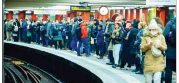
एजेसी >>> बर्लिन

जर्मनी में अचानक हुई ट्रेन स्ट्राइक से लाखों लोग परेशान हैं। जर्मनी के ट्रेन स्ट्राइक का प्रतिनिधित्व करने वाले एक संघ ने काम के घंटों और वेतन को लेकर राज्य के स्वामित्व वाले मुख्य रेलवे ऑपरेटर के साथ विवाद के बाद बुधवार सुबह 3 दिवसीय हड़ताल शुरू कर दी। ट्रेनों के न चलने से रेलवे स्टेशनों पर सन्नाटा पसरा हुआ है। देश भर में और कई शहरों में ट्रेन यात्रा लगभग ठप हो गई है। यात्री बस या कार यात्रा या फ्लाइट से लेकर लंबी दूरी के लिए ट्रेन के दूसरे विकल्प खोजने के लिए संघर्ष कर रहे हैं। राज्य के स्वामित्व वाली डॉयचे बान ने कहा कि लंबी दूरी की केवल 20% ट्रेनें चल रही थीं। बर्लिन में कन्स्यूट ट्रेनें भी परिचालन में नहीं थीं। मालगाड़ियों को लेकर जीडीएल यूनिन की हड़ताल मंगलवार शाम से शुरू हो गई।